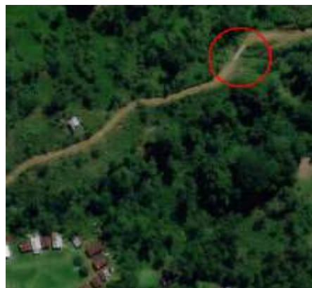
Fig. 1 – Localización General vía La Balsa - Las Brisas

Para acceder al sitio desde Tumaco se toma la vía carretable Tumaco – Pasto tomando la entrada a Candelillas y desviándose por la vía que conduce al Puente Internacional Mataje, antes de llegar al puente se toma por la población de Restrepo hasta llegar a la vereda La Balsa, en un recorrido aproximado de 30 min.