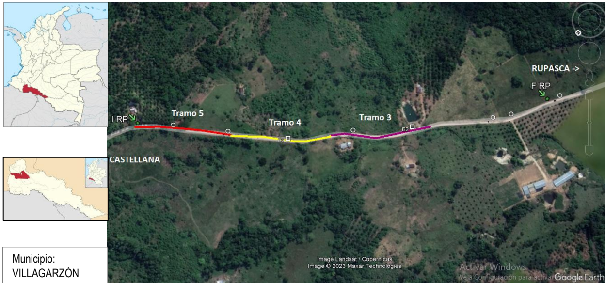
Figura 1: Localización de placa huella objeto de intervención municipio de Villagarzón.

El tramo vial objeto del mejoramiento mediante la construcción de placa huella está localizado en el municipio de Villagarzón departamento de Putumayo entre las veredas La Castellana y Rupasca, tal como se puede observar en la Figura 1 (ver línea roja). Localización de los tramos por AFT proyectadas en el corredor objeto de intervención.