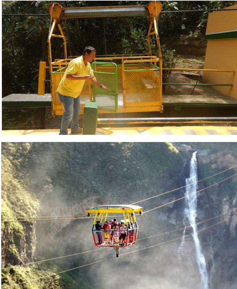
Figura 1: Esquema guía de tarabita

A continuación, se presentan algunos esquemas y/o imágenes de tarabitas seguras con capacidad apta para la meta de la AFT (dos personas y una moto).